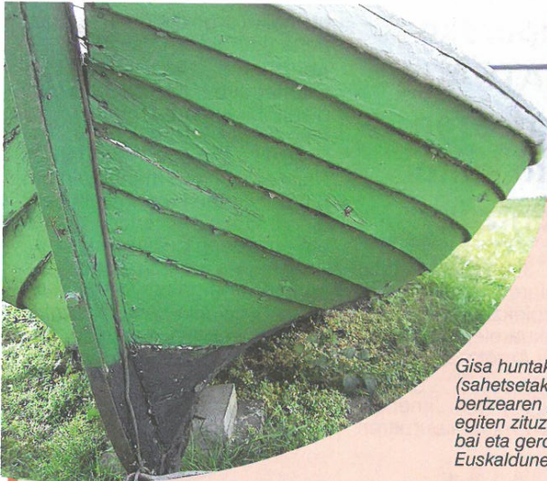
Gisa huntako barkuak (sahetsetako taulak bat bertzearen gainean) egiten zituzten Vikingek, bai eta geroago Euskaldunek